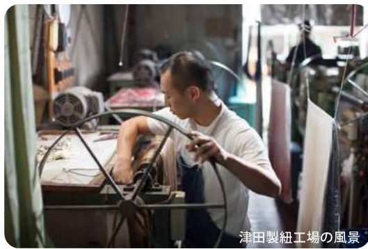
津田製紐工場の風景

YOSHIWARA CHUO CULTURE CENTRE 吉原中央文化 芸術交差点 FUJI SHIZUOKA